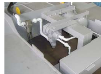
貫通ブレーキ装置